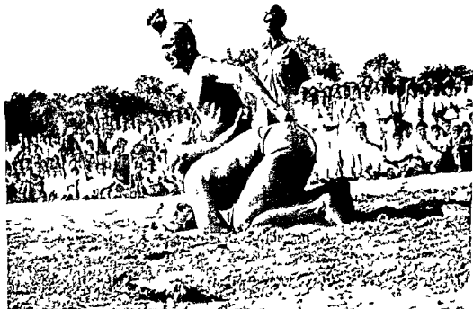
Fig 5 Vajramuṣṭi Wrestling End